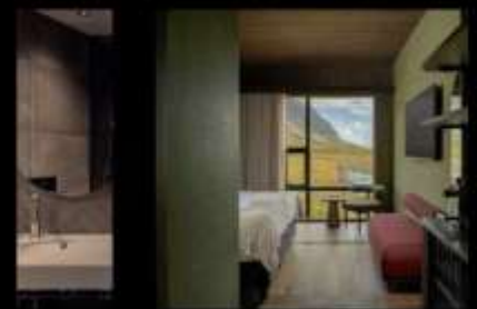
HÓTEL JÖKULSARLON - GLACIER LAGOON HOTEL