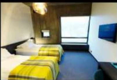
FOSSHOTEL GLACIER LAGOON

(โรงแรมในเขต South Shore มีน้อยและค่อนข้างจำกัด ไม่เพียงพอต่อปริมาณนักท่องเที่ยว ทางบริษัทฯ จะเลือกสรรโรงแรมที่ดีและเหมาะสม) ค่าคืนนี้ท่านสามารถล่าแสงเหนือได้จากที่พักโรงแรม NORTHERN LIGHT (AURORA BOREALIS) เป็นปรากฏการณ์ที่เกิดขึ้นตามธรรมชาติในเขตบริเวณขั้วโลกเหนือในกลุ่มประเทศที่อยู่เหนือเส้นอาร์กติก เซอร์เคิล โดยมีประเทศไอซ์แลนด์รวมอยู่ด้วย มักจะพบเห็นได้ทั่วไปเนื่องจากเป็นแสงที่มาจากชั้นบรรยากาศเหนือพื้นโลกไปราว 100-300 ก.ม. โดยจะเห็นได้ชัดเจนในช่วงเวลาฟ้าเปิด และอยู่ในระหว่าง เดือนกันยายน-เดือนเมษายน ของทุกปี