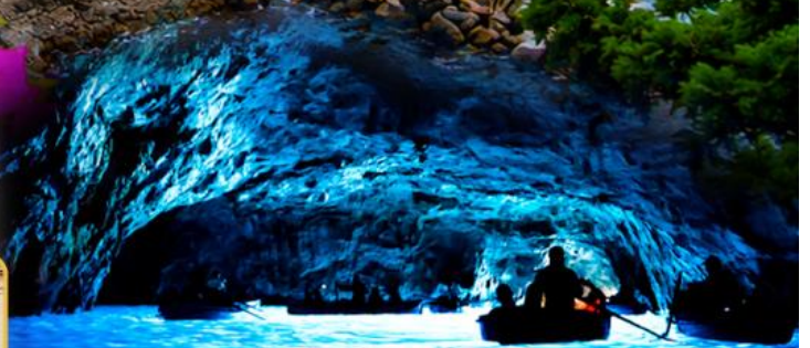
บลูกรอตโต

พิเศษ!! ล่องเรือไฮโดรฟอยด์สู่เกาะคาปรี ชมบลูกรอตโต และดินแดน 5 หมู่บ้านซิงเกวแตรโร