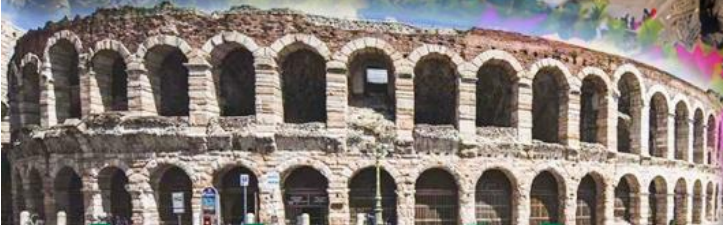
โรงละครโรมันกลางจั๊วงเวโรนา