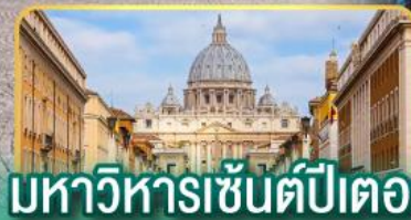
มหาวิหารเซ็นต์ปีเตอร์