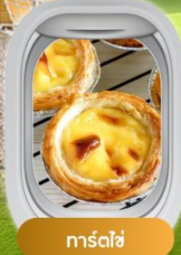
ทาร์ตไข่