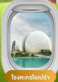
โรงละครโอเปร่า