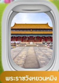
พระราชวังหยวนหมิง