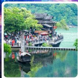
หมู่บ้านชาวน้ำเสี่ยเหรินเจีย