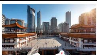
ตึกขุยซิ่ง

พระแกะสลักหินต้าจู่ - หลุมฟ้าสะพานสวรรค์ - เจนางฟ้า ตึกขุยซิ่ง - ตึกตะเกียบ - หมู่บ้านโบราณฉือชิว