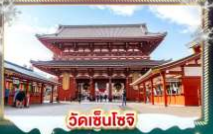
วัดเซ็นโซจิ