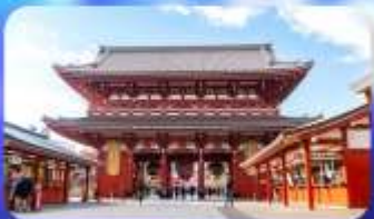
วัดเซ็นโซจิ