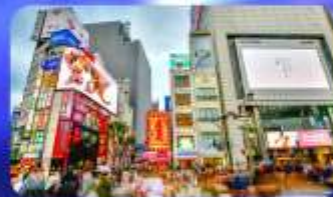
ซัปโปริงชินจูกุ