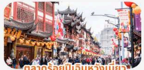
ตลาดร้อยปีเดินหวังเมี่ยว