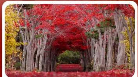
สวนลับชิราอิเกะ