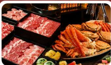
บุฟเฟ่ต์ซาซิมิ 3 ชนิด