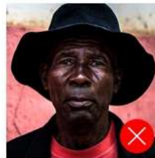
Back side is colored