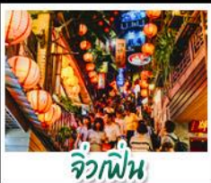
จิวเฟิ่น