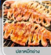
ปลาหมึกย่าง