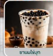
ชาวมโซบุก