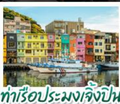
ท่าเรือประมงเจี๋ยปิ่น