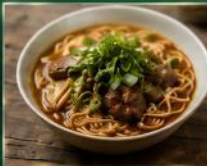
บะหมี่อาจ บะหมี่เนื้อตุ๋นสุอรเด้นตำรับ หอมย่นุ่มกลล่อม

แหล่งรวมอาหารท้องถิ่นแะของฝากยอดนิยมของไต้หวัน อาทิ