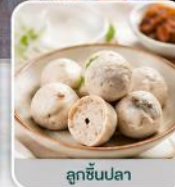
ลูกชิ้นปลา