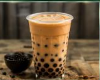
ชานมไข่มุก ชานมหอมละมุน ไข่มุกเหนียมนุ่ม เครื่องดื่มนยอดฮิตระดับโลก