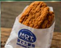
ไก่ทอดฮ็อตสตาร์ ไก่ทอดชิ้นใหญ่กรอบนอก นุ่มใน รสชาติที่ใครมาไต้หวันต้องลอง