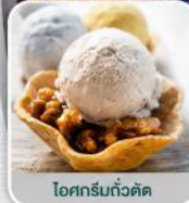
ไอศกรีมถั่วตัด