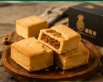
พายสิ่ลัคคองไต้หวัน พายสิ่ลัคคองไต้หวัน ของฝากยอดนิยมจากไต้หวัน