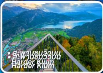
• สะพานชมวิวยอด Harder Kletterbahn