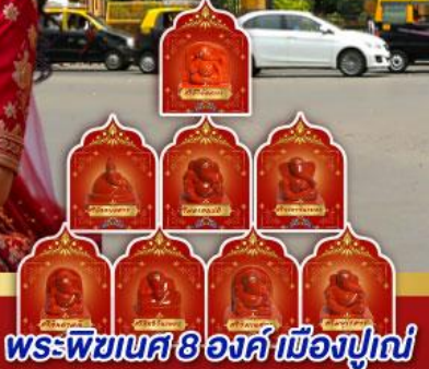
พระพิฆเนศ 8 องค์ เมืองปูणे