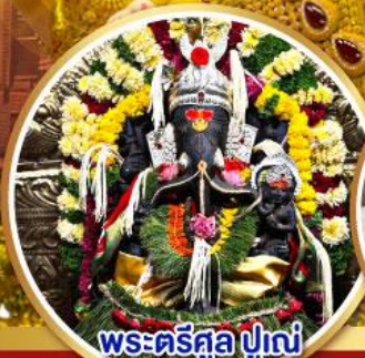
พระตรีศูล ปูणे (Trishul Pune)