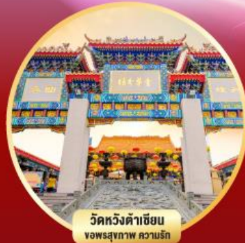
วัดหวังต้าเซียน ขอพรสุขภาพ ความรัก