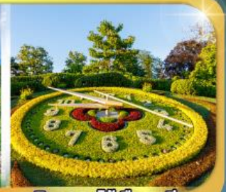
นาฬิกาดอกไม้เมืองจนีวา