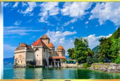
ปราสาทชิลยง