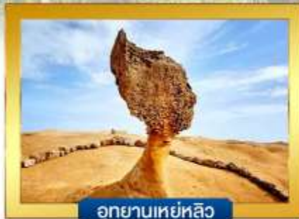
อุทยานเหย่หลิว