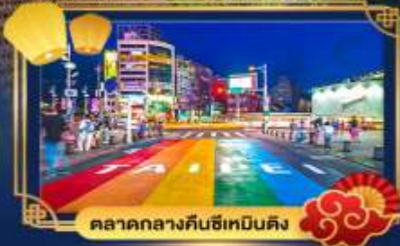
ตลาดกลางคืนซีเหมินติง