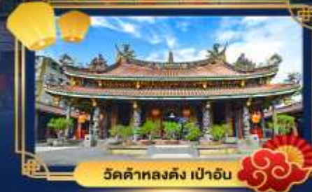
วัดต้าหลงต้ง เป่าอัน