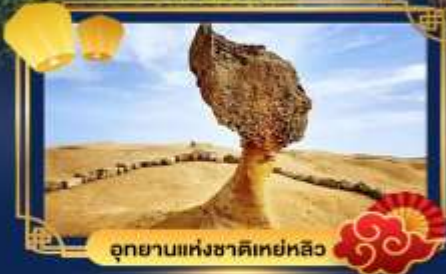
อุทยานแห่งชาติเขย่หลิว