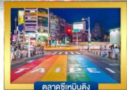
ตลาดซีเหมินติง