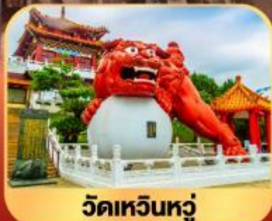
วัดเหวินหนู่